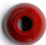
Rojo esmaltado Glazed red Rouge émaillée