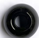
Negro esmaltado Glazed black Noir émaillée