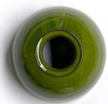
Verde esmaltado Glazed green Verte émaillée