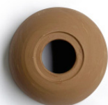
Terracota natural Natural terracotta Terre cuite naturelle

Couleurs de l'abat-jour en céramique en terre cuite naturelle ou émaillée