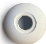
Blanco mate natural Natural matt white Blanc mat naturel