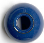
Azul esmaltado Glazed blue Bleu émaillée