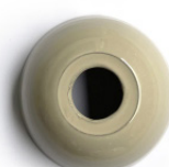
Beige esmaltado Glazed beige Beige émaillée