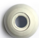
Blanco esmaltado Glazed white Blanc émaillée