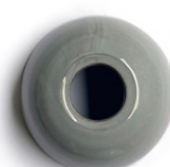
Gris esmaltado Glazed grey Gris émaillée